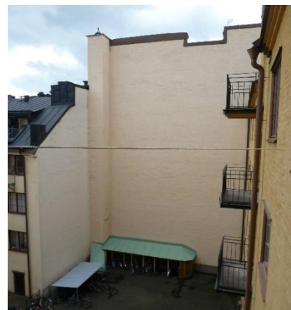
Befintlig gårdsbebyggelse/brandvägg i Smeden 4