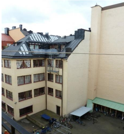
Befintlig gårdsbebyggelse/brandvägg i Smeden 3